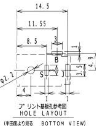
プリント基板孔参考図 HOLE LAYOUT (半田面より見る BOTTOM VIEW)